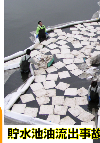
貯水池油流出事故