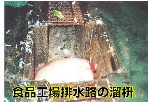
食品工場排水路の溜枳